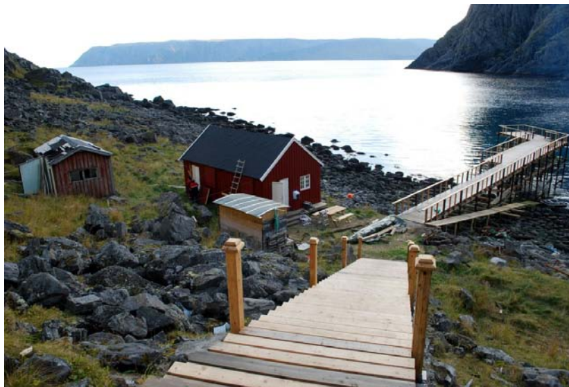
Hornvika 2012

Hornvika er en del av gnr 4/1/6 som festes av Nordkapp 1990 ANS, og inngår i den kommersielle driften av Nordkapp-platået.